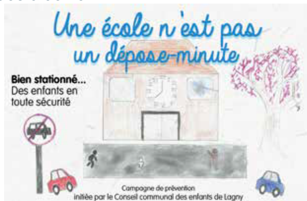
Affiche pédagogique réalisée par les élus du conseil communal des enfants de Lagny-sur-marne, 2025

Un parvis agréable peut devenir un lieu de convivialité entre parents et enfants lors des sorties d'école